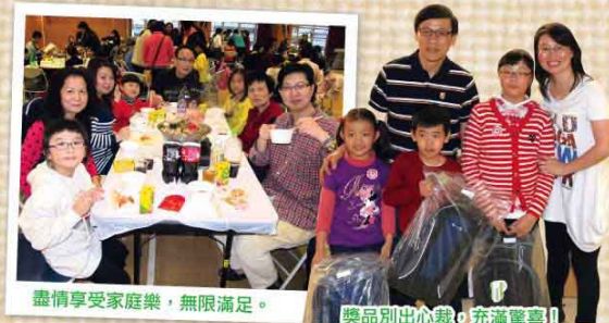
盡情享受家庭樂,無限滿足。