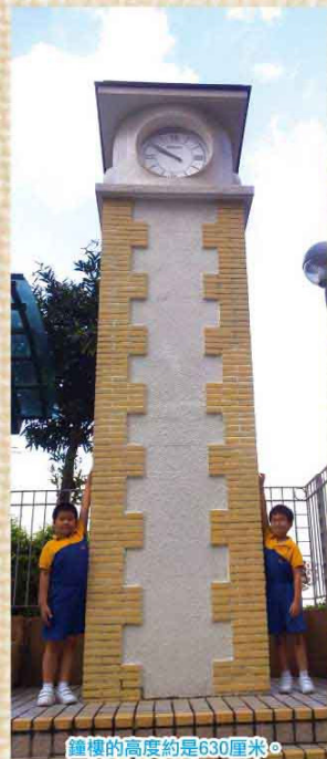
鐘樓的高度約是630厘米。

為了讓同學對學校有更深刻的認識，數學科共提問了四道問題，同學積極參與，嘗試用不同方法找出答案，不少同學都答對了。