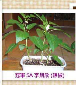
冠軍 5A 李朗欣 (辣椒)