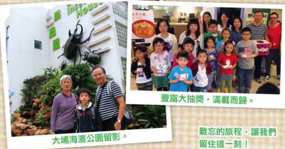
大埔海濱公園留影。