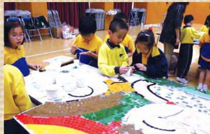
▲ 同學們發揮合作精神，齊心拼砌馬賽克。

為了培養學生關愛他人及積極面對人生的價值觀，並締造一個更優美的校園，本校特意舉辦「十『Fun』關愛·十『Fun』積極」小劇場馬賽克親子壁畫畫稿設計比賽及親子馬賽克工作坊，希望透過集體藝術創作活動，促進學生與家長互相溝通。另外，更設有小劇場馬賽克壁畫創作天，讓全校學生合作完成大型馬賽克壁畫，共同營造一個具歸屬感的理想校園。