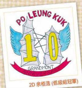
2D 余栢浩 (低級組冠軍)