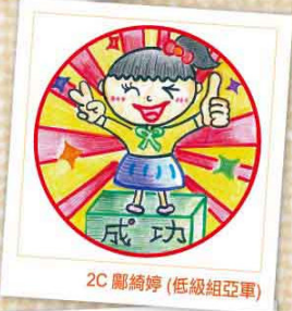
2C 鄺綺婷 (低級組亞軍)