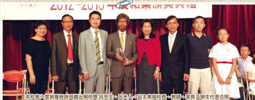
本校第六度榮獲保良局傑出學校獎 呂先生、呂夫人、呂主席與校長、教師、家長及學生代表合照