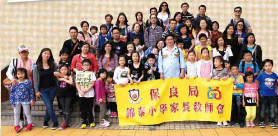
保良局錦泰小學家長教師會