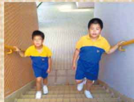
由地下至天台三梯的總梯級是187級。