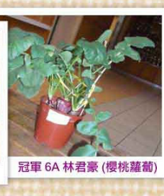
冠軍 6A 林君豪 (櫻桃蘿蔔)