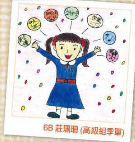
6B 莊珮珊 (高級組季軍)