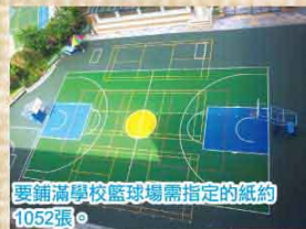
要鋪滿學校籃球場需指定的紙約1052張。