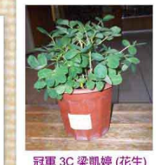
冠軍 3C 梁凱婷 (花生)