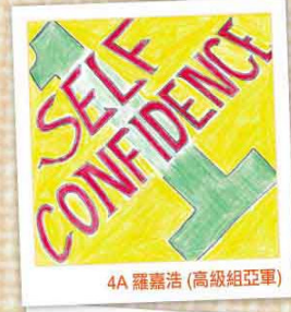
4A 羅嘉浩 (高級組亞軍)