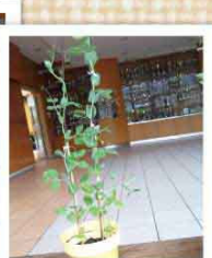
冠軍 2B 張樂謙 (荷蘭豆)