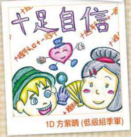
1D 方紫晴 (低級組季軍)