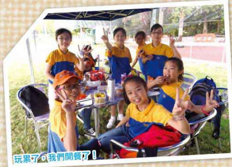
玩累了，我們開餐了！

趁着創校四十一周年暨遷校十周年這喜慶的日子，本校特別舉行「全校旅行班內攝影比賽」，以十周年為主題，同學將旅行時愉快的活動情況、所見所聞，以「十」的造型拍攝下來。全校師生既可感受到校慶的歡樂氣氛，又可參與校慶活動，共同歡慶這有意義的日子。