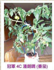
冠軍 4C 潘朗晴 (番茄)