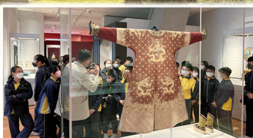
齊來猜猜九五之尊的龍袍上繡有甚麼圖紋？