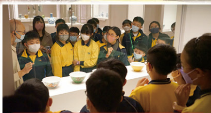
同學正用心聆聽後宮陶瓷食具上圖紋用色與身份象徵的故事。

是次參觀活動有效鞏固學生對國家的認識及認同，擴闊他們的眼界，培養他們的民族自豪感。