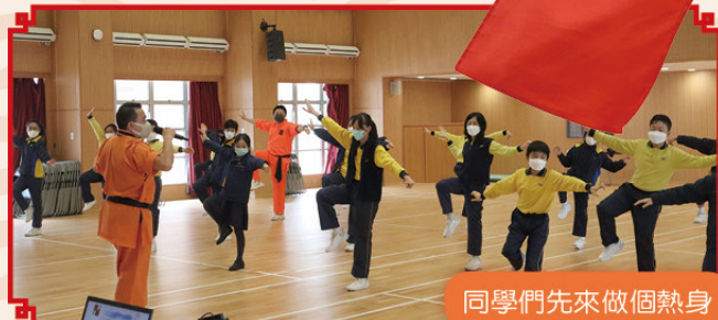
同學們先來做個熱身

學完「面塑」後，同學們就向廖師傅學習「舞旗」。舞旗歷史源遠流長，其中的文化和禮儀都很值得我們學習。同學們聽過廖師傅的講解後，便正式上場學習勾掌、放旗、取旗、持旗及各種花式，如「揚」、「八字轉」等技巧。有些同學身手不凡，一學即懂；而有些同學則屢敗屢試，發揮堅毅不屈的精神，真是值得讚許。