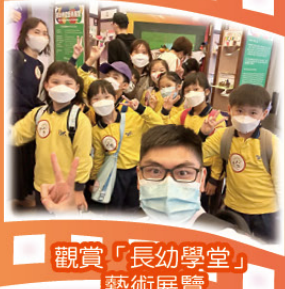
觀賞「長幼學堂」藝術展覽