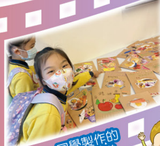
同學製作的精美菜譜