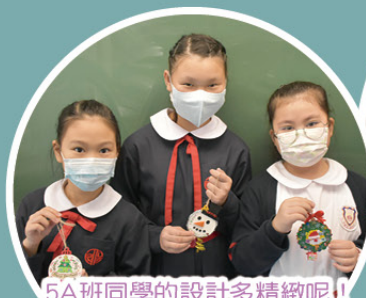
5A班同學的設計多精緻呢!!

為培養學生關心別人的正向態度，並營造校園歡樂的正向氣氛，訓輔及學生成長組藉着聖誕佳節，舉辦了「聖誕祝福吊飾」創作活動。此活動邀請了校長、老師、家長和同學們一起設計吊飾，各展所長，設計出別出心裁的吊飾。完成創作後，我們把大家創作精美的作品裝飾校園聖誕樹外，還用作佈置校園環境，包括課室、教員室、升降機等，為校園增添聖誕歡樂的氣氛，送給大家暖暖的祝福呢！讓我們一起欣賞大家的創作吧！