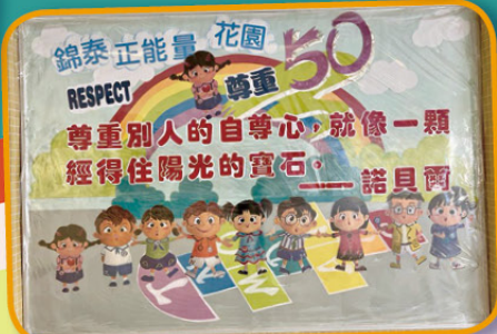
「錦泰正能量我有『SAY』!」，讓同學分享實踐成果，令假期過得更有意義