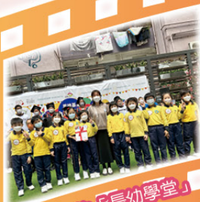
我們的「長幼學堂」畢業了