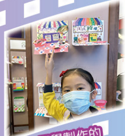
同學製作的香港攤檔