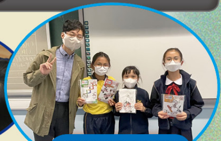
匯報勝出的組別與老師一起大合照