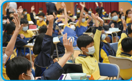
同學們積極參與討論及投入活動

科技日新月異，人工智能(AI)逐漸影響我們日常的生活。為了讓學生認識「人工智能」的概念及應用，本校成功申請「小學奇趣IT識多啲計畫」，與校外機構合作，於2022年11月為五年級學生舉辦了專題研習-「人工智能」，讓學生透過體驗 Google Teachable Machine建立物件辨認資料庫及利用PictoBlo設計遊戲，豐富他們課堂以外的學習經歷。全級學生在禮堂一同學習，互相交流，啟發他們對「人工智能」的興趣。各班學生於2023年1月在課室分組匯報如何利用「人工智能」解決生活的問題，有效提升他們善用科技解難的能力。