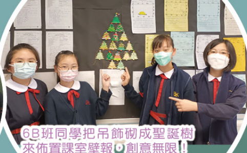
6B班同學把吊飾砌成聖誕樹來佈置課室壁報，創意無限!!