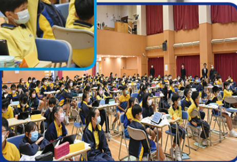
五年級同學一同參與「人工智能」體驗活動