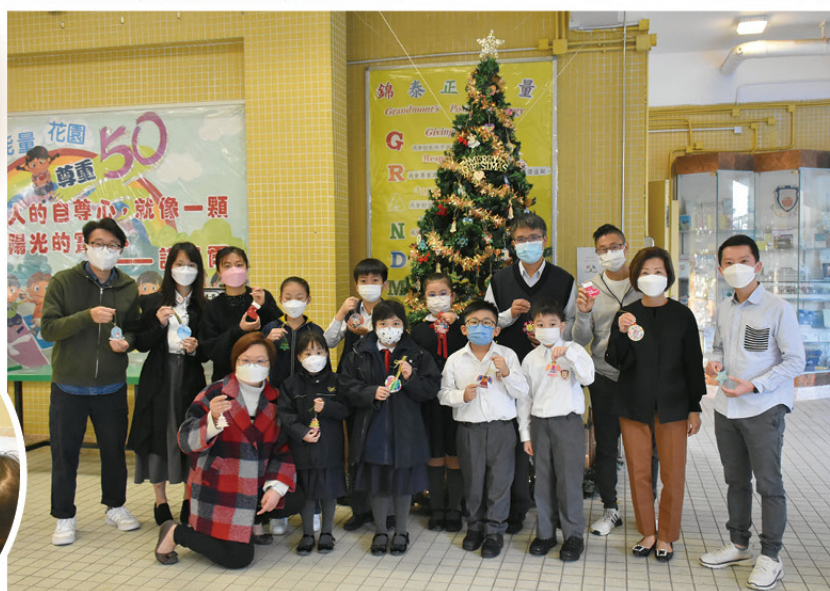
吳校長、老師和同學們一起佈置聖誕樹