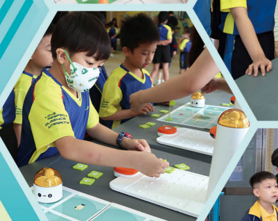
同學進行不插電編程