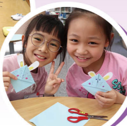
We made cute paper rabbit origami bookmarks in Japan.