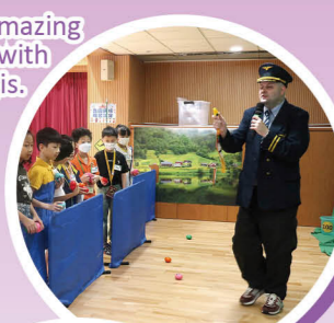
Mr. Newman showed amazing Aussie animals with heart emojis.