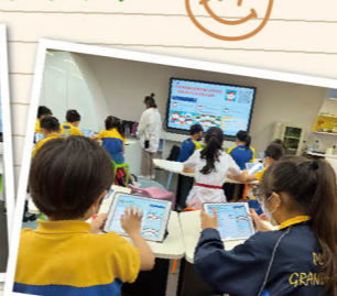
透過遊戲及各式體驗活動，「明辨資訊大使」明白到網上假資訊是如何產生的。