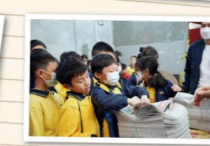
同學們覺得「新鮮出爐」的報紙十分有「份量」。