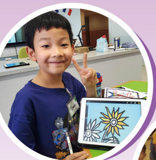
We painted Sunflowers in Vincent van Gogh style.