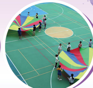
How high can your team's dolphin plushie jump? Can you spin the ball around the edge?