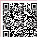
保良局粵劇暨中華文化匯演