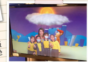
同學們在藍幕前與「天氣先生」一同報道天氣，他們都覺得十分有趣。