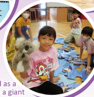
We worked as a team to solve a giant postcard puzzle.