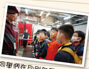
同學們在印刷部留心聆聽總管講解印刷報紙的流程。

二零二四年三月二十日，全體四年級學生參觀星島報社。老師向學生介紹報社資料室和記者的工作，也向學生講解分辨真假新聞的重要性。